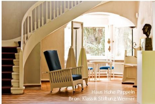
Haus Hohe Pappeln