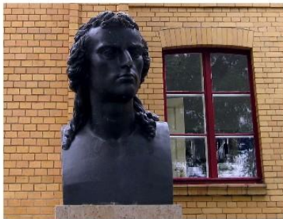
Huis en tuin van Friedrich Schiller in Jena